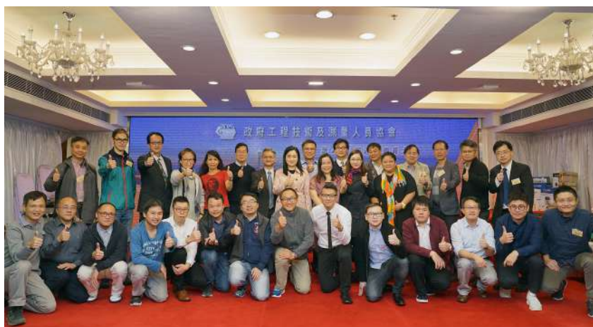
第四十二屆理事會成員與嘉賓合照